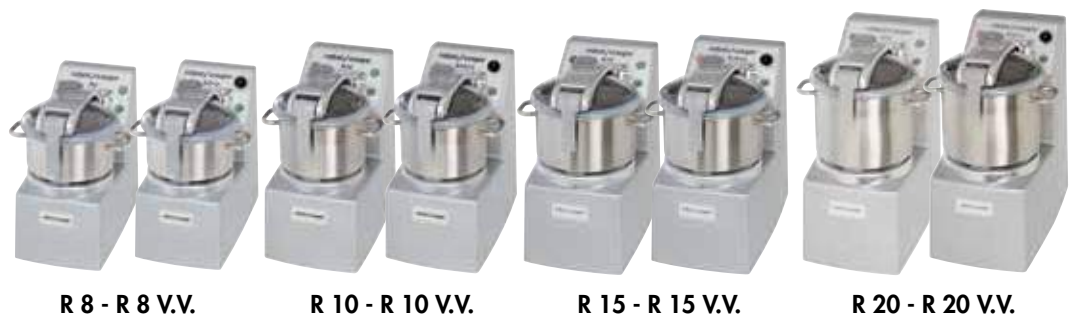
R 8 - R 8 V.V.